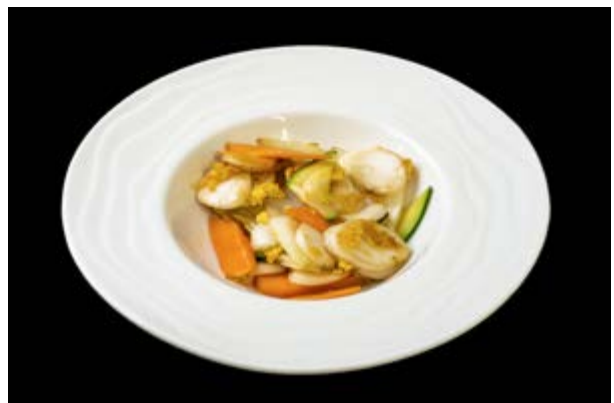
221. Gnocchi di riso con verdure € 9 (15)