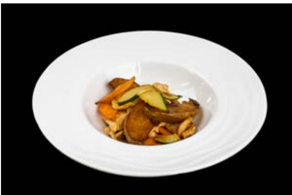
288. Pollo saltato con verdure € 7 (6)