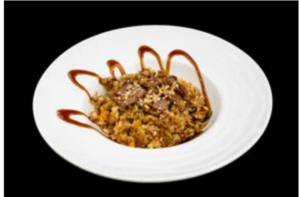
217. Riso con manzo e verdure € 8 RISO, MANZO, VERDURE, SESAMO, ARACHIDI, SALSA MISO, TERIYAKI (3-6- 8)