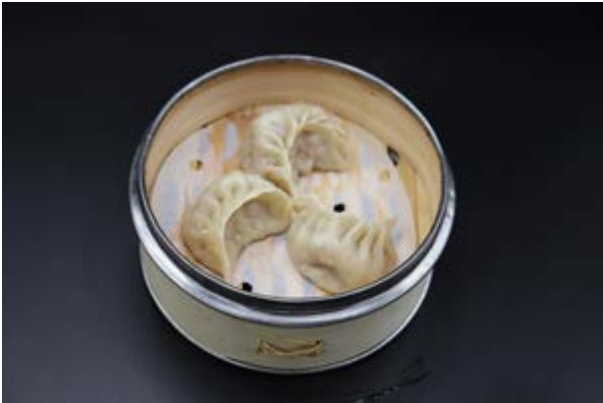
55. Gyoza di carne € 5 RAVIOLI DI CARNE (1-3-6)*