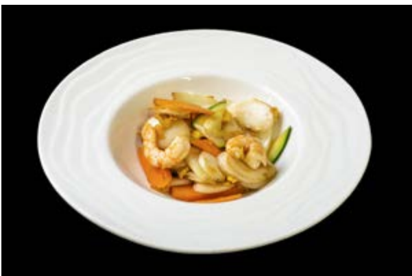
220. Gnocchi di riso con gamberi € 9 (2)*