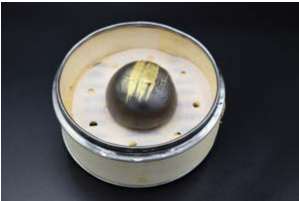
52. Bao black € 3 1pz Pane dolce al vapore con salsa crema (1-7-15)