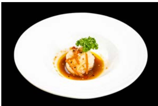
290. Pesce bianco al vapore € 8 (massimo 1 volta a persona) (4-6)*