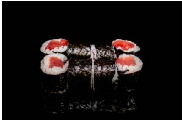
181. Tekka maki € 4 8pz TONNO (4)