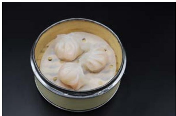
60. Ebi Gyoza € 6 RAVIOLI DI GAMBERI (1-2-6)*