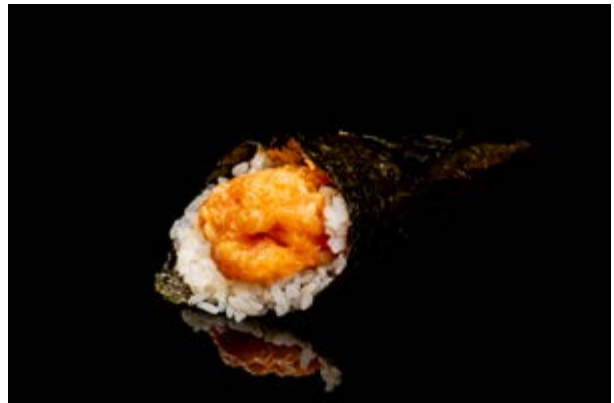
201. Temaki spicy salmone € 5 TARTARA DI SALMONE SPICY (3-4)