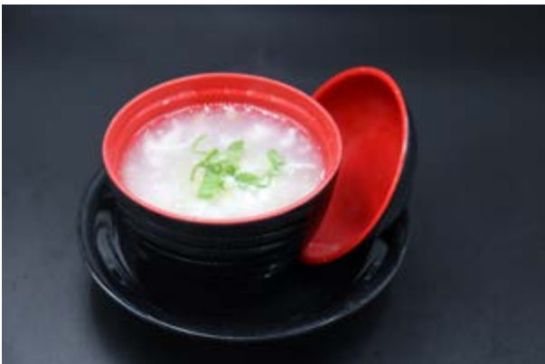
32. Zuppa pollo e mais € 3 ZUPPA CON POLLO, MAIS, UOVA, ERBA CIPOLLINA (3)