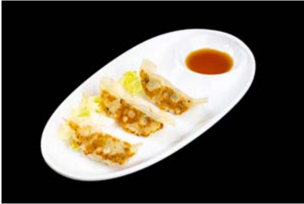
61. Gyoza di pollo € 5 RAVIOLI DI POLLO ALLA PIASTRA (1-6)*