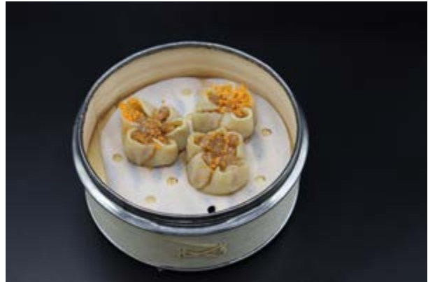
56. Shaomai € 5 RAVIOLI DI GAMBERI E PANCETTA (1-2-3-4-6)*