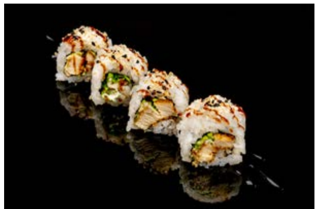
133. Chicken roll € 8 4pz POLLO FRITTO , MAIONESE , INSALATA, SESAMO, TERIYAKI (1-3-6-11)*