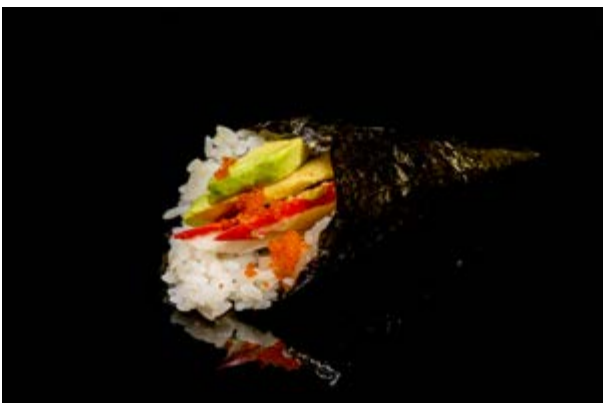
196. Temaki california € 5 SURIMI DI GRANCHIO,AVOCADO ,MAIONESE , TOBIKO (2-3)*