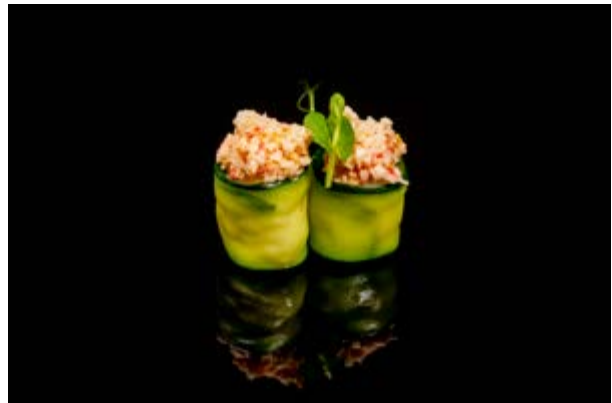
116. Gunkan zucchini € 5 MAIONESE, ZUCCHINE, GAMBERI, SURIMI, TOBIKO (2-3)