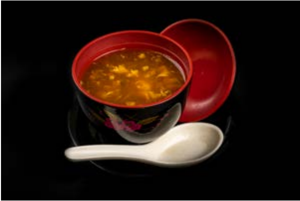
30. Zuppa agropiccante € 3 ZUPPA CON TOFU , FUNGHI , UOVA (3)