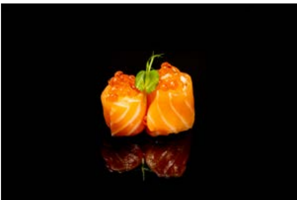
117. Gunkan ikura € 5 SALMONE E IKURA (4)