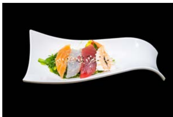
6. Sunomono € 6 ALGHE CON PESCE MISTO (2-4-11)*