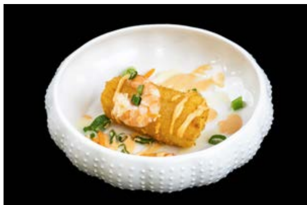
622. Tofu fritto € 5 TOFU FRITTO CON GAMBERI , CIPOLLINA E SPICY MAYO (1-2-3)