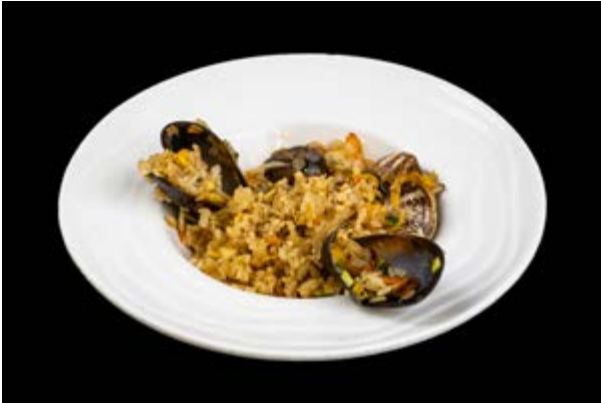
216. Riso con frutti di mare € 9 (2-3-4-6-8)*