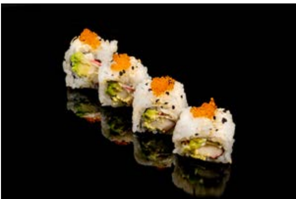
132. California roll € 8 4pz SURIMI DI GRANCHIO, AVOCADO, TOBIKO, MAIONESE, SESAMO (2-3-11)*