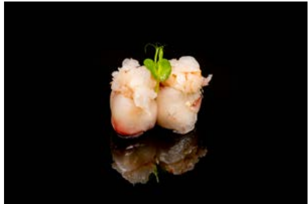
114. Gunkan Rosè € 5 (2-4)