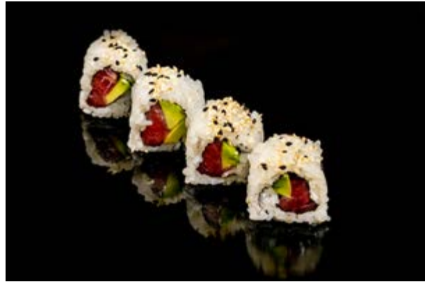
131. Tuna roll € 9 4pz TONNO AVOCADO, SESAMO (4-11)