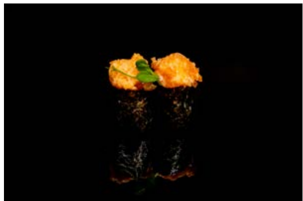
118. Gunkan spicy salmone € 5 (4)