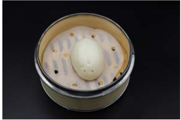
51. Bao dolce € 3 (1-7-15)*