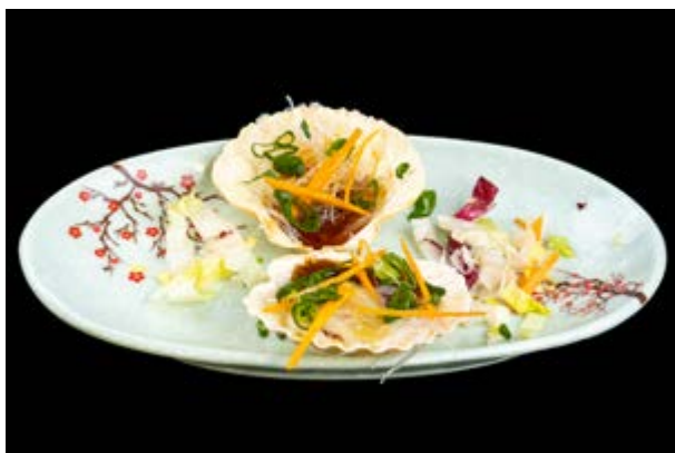
292. Capesante al vapore € 12 (massimo 1 volta a persona) CAPESANTE AL VAPORE CON SALSA DI SOIA E ACETO, ERBA CIPOLLINA (1-6-14)