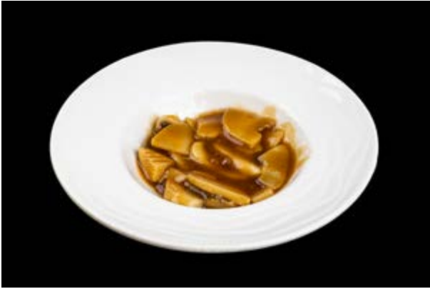
294. Bambù e funghi € 5 (15)