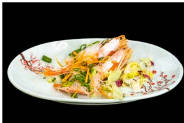
291. Gamberoni al vapore € 12 (massimo 1 volta a persona) GAMBERI AL VAPORE CON SALSA DI SOIA E ACETO, ERBA CIPOLLINA (1-2-6)*