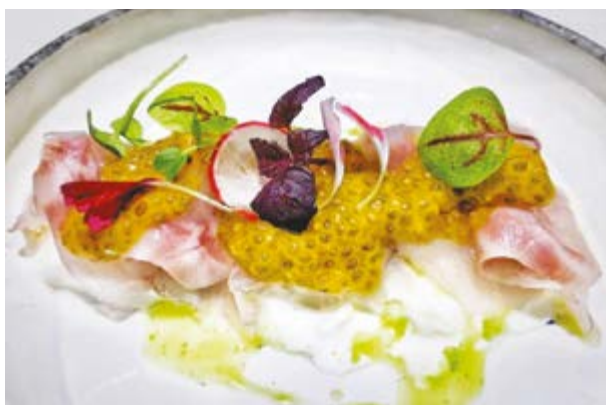
623. Ricciola con mozzarella di bufala € 15,00 RICCIOLA CON MOZZARELLA DI BUFALA E PASSION FRUIT (2-4)