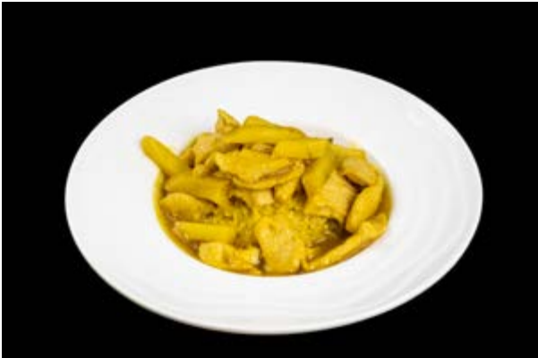
218. Curry Gohan € 8 (1)*