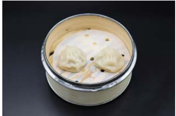
53. Xiao long bao € 3 2pz Bao al vapore ripieno con carne di maiale (1-7)*