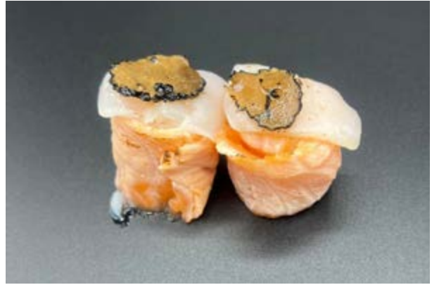
125. Gunkan delicious flambè € 6 SALMONE , CAPASANTA , TARTUFO , SALSA PASSION FRUIT (4-14)