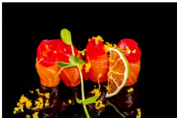
619. Salmone affumicato con barbabietola € 12 (4)