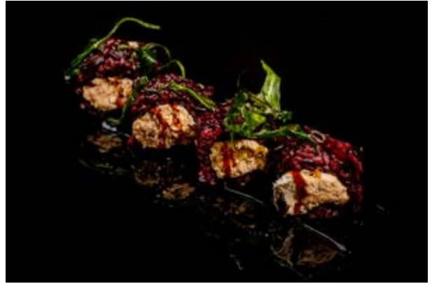
165. Miura black € 10 4pz SALMONE COTTO E PHILADELPHIA , RUCOLA FRITTA E TERIYAKI (1-4-6-7)