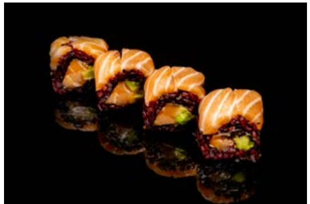
169. Salmon venus € 10 4pz SALMONE AVOCADO, PHILADELPHIA (4-7)