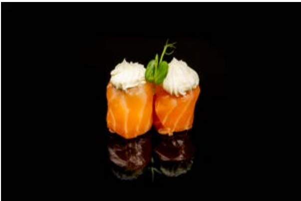
115. Salmone out philadelphia € 5 (4-7)