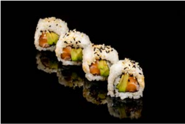
130. Salmone roll € 8 4pz SALMONE AVOCADO, SESAMO (4-11)