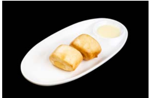
64. Bao fritto € 3 (1-7-15)*