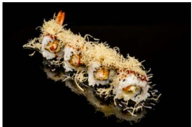
139. Ebiten roll € 9 4pz GAMBERO IN TEMPURA , MAIONESE , KADAFI E TERIYAKI (1-2-3-6)*