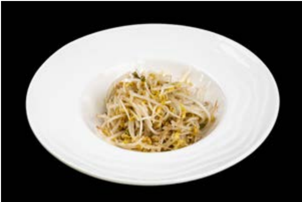
296. Germogli di soia € 5 (15)