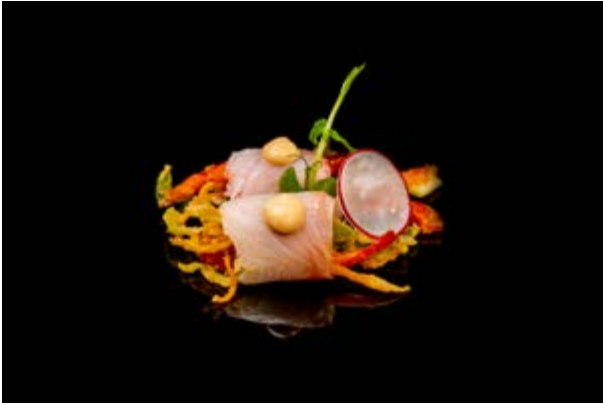
124. Crunchy ricciola € 6 RICCIOLA, VERDURA MISTA IN TEMPURA, SALSA SPICY MAYO (1-3-4)