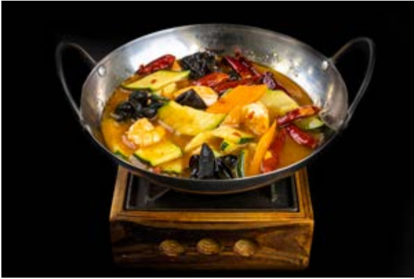
280. Scodella di gamberi € 10 GAMBERI , FUNGHI , CAROTE , ZUCCHINE ,PEPERONCINO (2-6-16)*