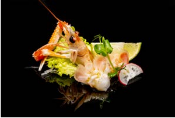
612. Scampi € 7 (2)*