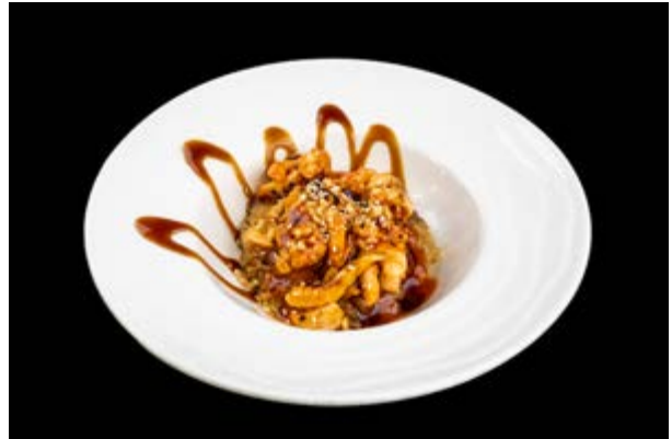
219. Zen don € 10 RISO, POLLO, GAMBERI, VERDURE, SESAMO, ARACHIDI, SALSA MISO, TERIYAKI (2-6-8)*