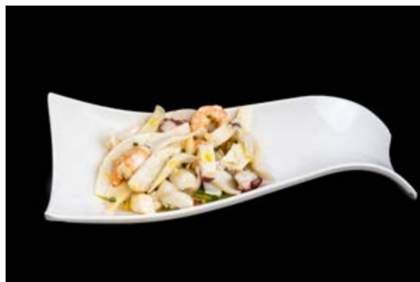
4. Frutti di mare misti € 6 GAMBERI , POLIPO, CALAMARO (2-14)*