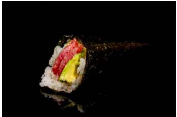
199. Temaki tonno avocado € 5 TONNO AVOCADO (4)