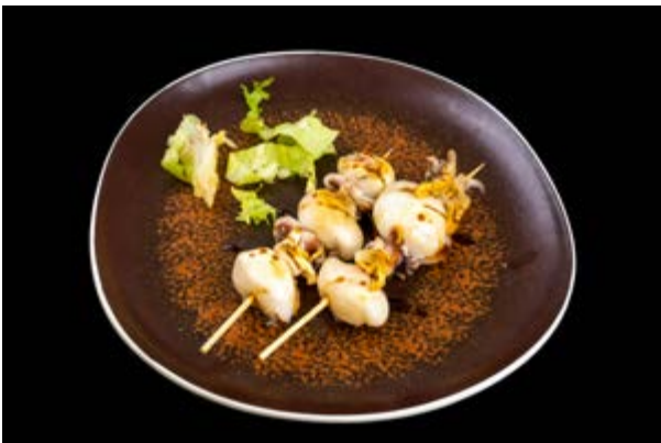
264. Spiedini di seppia € 10 SEPIE E TERIYAKI (2-6)*