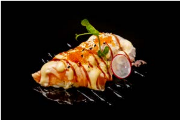
111. Nigiri special burn € 10 SALMONE, TONNO, BRANZINO SCOTTATI, TOBIKO, SESAMO, SALSA MISO E TERIYAKI (4-6-11)