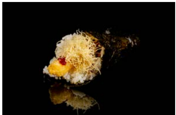
197. Temaki ebiten € 5 GAMBERO IN TEMPURA , MAIONESE , KADAIFY , TERIYAKI (1-2-3-6)*