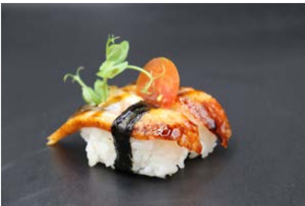
110. Nigiri anguilla € 4 ANGUILLA, SALSA TERIYAKI (4-11)*