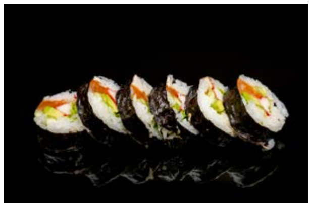
185. Futomaki € 12 4pz SALMONE AVOCADO SURIMI CETRIOLI TOBIKO PHILADELPHIA INSALATA (3-4- 6)*