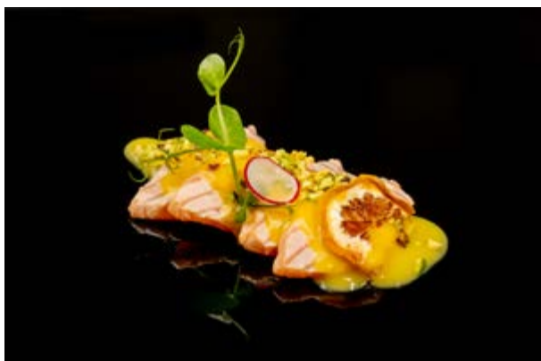
620. Sashimi scottato € 12 SALMONE SCOTTATO CON SALSA MANGO E PISTACCHIO (4-8)