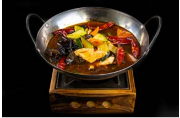
281. Scodella di pollo € 10 POLLO , FUNGHI , CAROTE , ZUCCHINE , PEPERONCINO (6-16)*