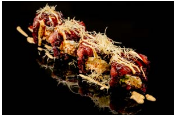
167. Miura plus venus € 14 4pz SALMONE FRITTO , PHILADELPHIA , TARTARA DI TONNO , MAIONESE SPICY , KADAIFI E TERIYAKI (1-3-4-6-7)