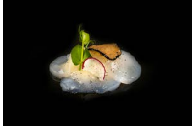
613. Capasanta con tartufo € 8 Bocconcini di pesce con philadelphia e teriyaki (7-14)*