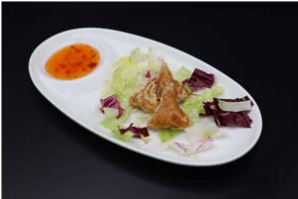
63. Gyoza fritto con pollo € 3 (1-7)*