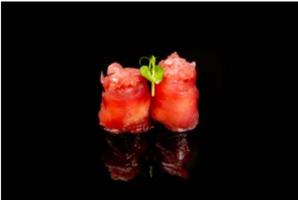
113. Gunkan tuna out € 5 (4)