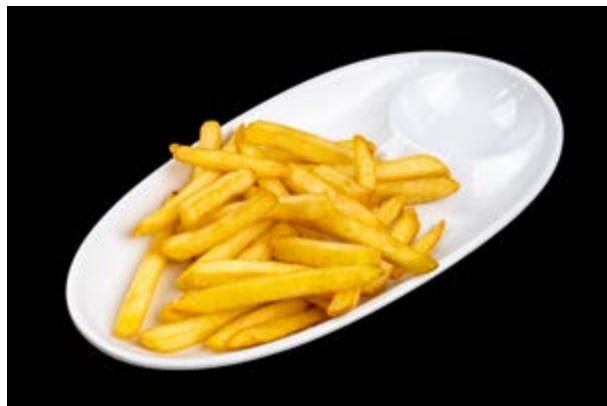
253. Patatine fritte € 3 (1)*