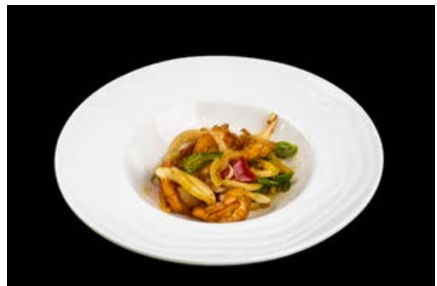
289. Gamberi sale e pepe € 8 (2)*