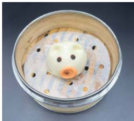
54. Bao con fagioli € 6 Pane dolce con fagioli rossi (1-7-15)