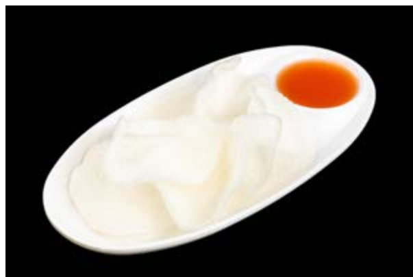
2. Nuvole € 3