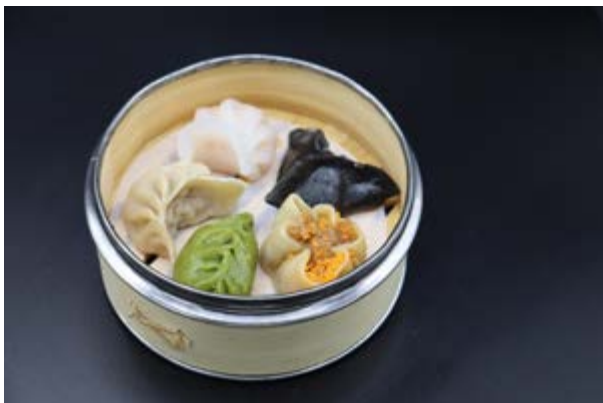
59. Gyoza mix € 6 RAVIOLI MISTI (1-2-3-4-6)*