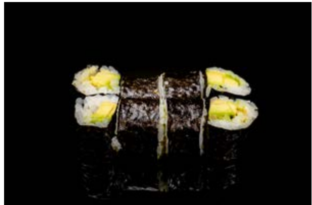
183. Avocado maki € 4 8pz AVOCADO (15)