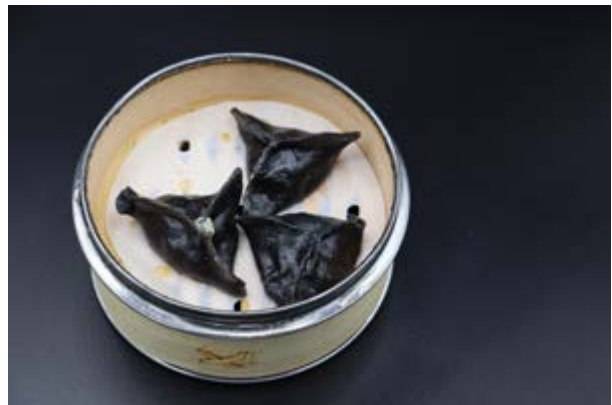
58. Suzuki Gyoza € 6 RAVIOLI DI PESCE BIANCO (1-4-6)*