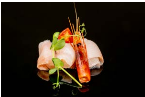
618. Ricciola e gamberi rossi € 12 RICCIOLA, GAMBERI ROSSI E SALSA AL FRUTTO DELLA PASSIONE (2-4)*