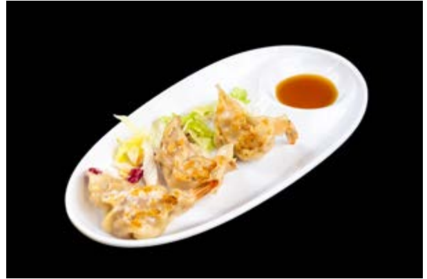
62. Niku Gyoza € 6 RAVIOLI DI CARNE ALLA PIASTRA (1-6)*